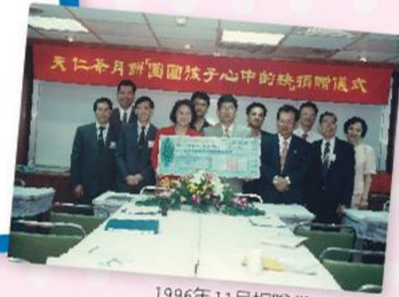
1996年11月捐贈儀式合影