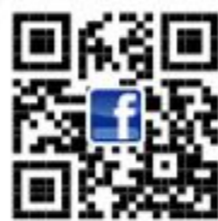
天仁茶文化館區粉絲團