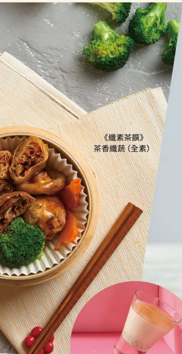
《纖素茶饌》 茶香纖蔬 (全素)