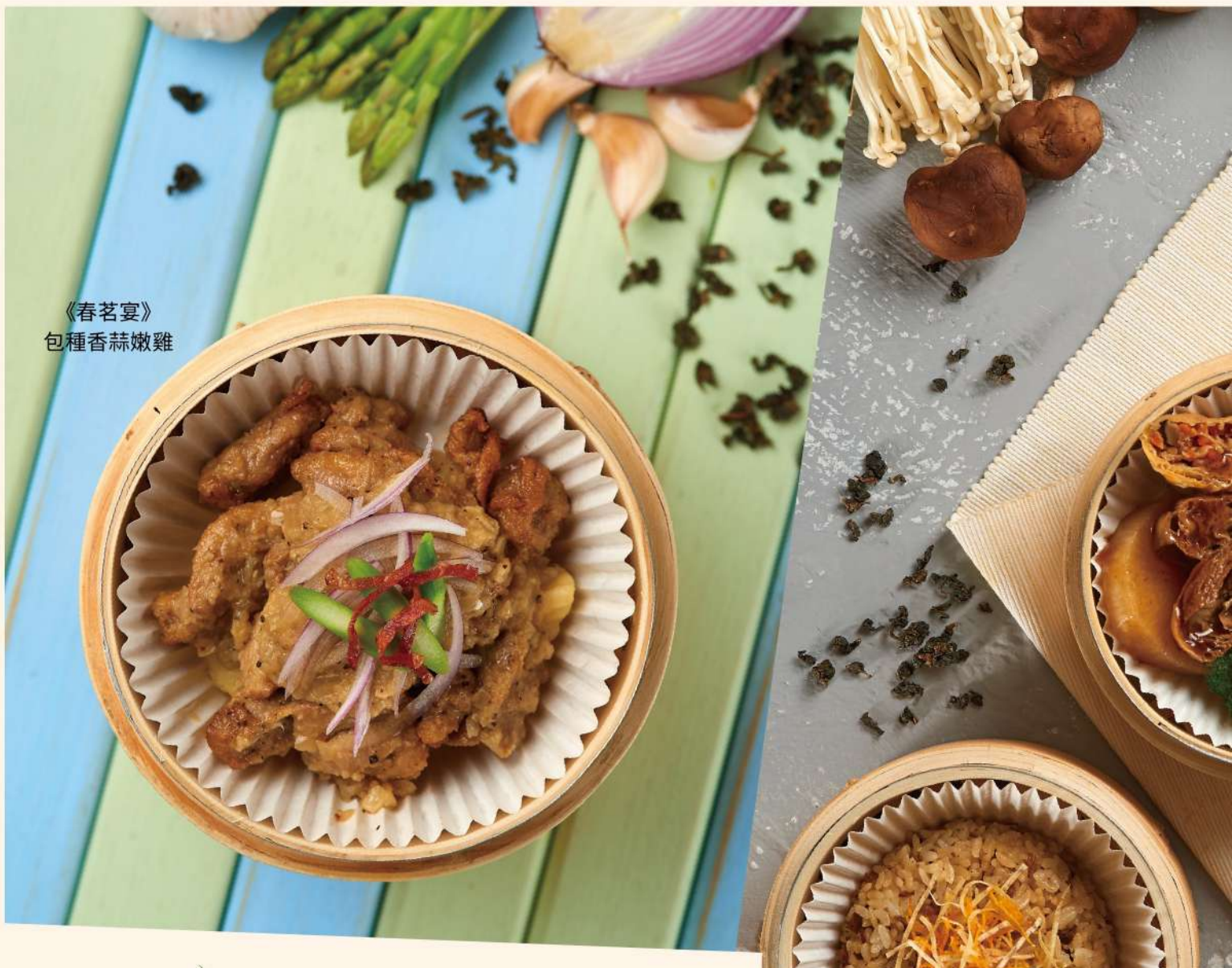
《春茗宴》 包種香蒜嫩雞