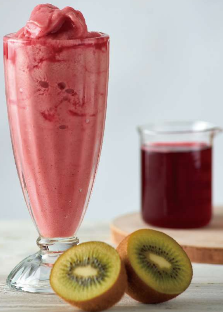
奇異洛神烏龍冰鑽