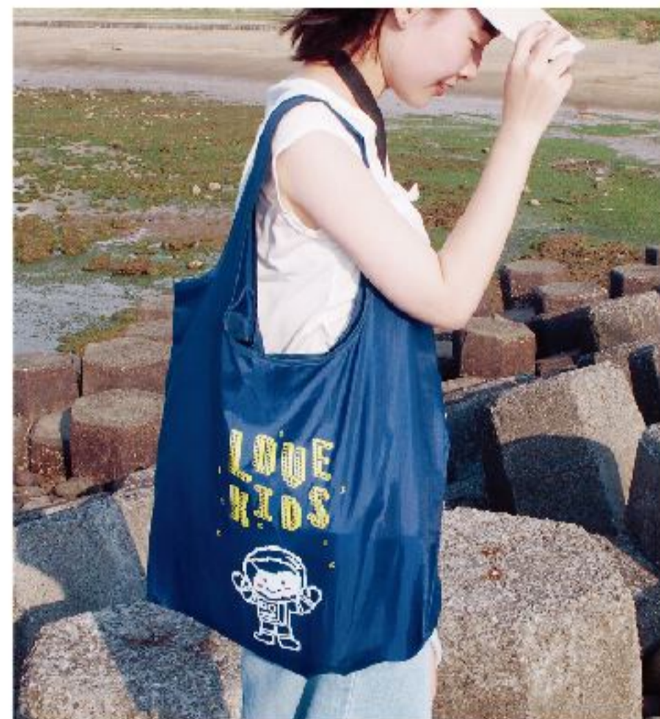
尺寸：平攤 | 寬47cm 高40cm (不含提把) 收納(外包裝) | 寬16cm 高15cm 材質：POLYESTER 牛津布