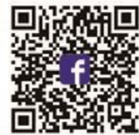
新加坡天仁粉絲團

咖啡色系的門市色調和原木質感的桌椅，跳脫已往的設計風格，給人咖啡廳般的悠閒感受，店內牆面有一幅世界地圖，標示著天仁、天福集團的世界據點，訴說這一甲子老朋友的故事，歡迎來到新加坡，喝杯我們用心泡的茶。