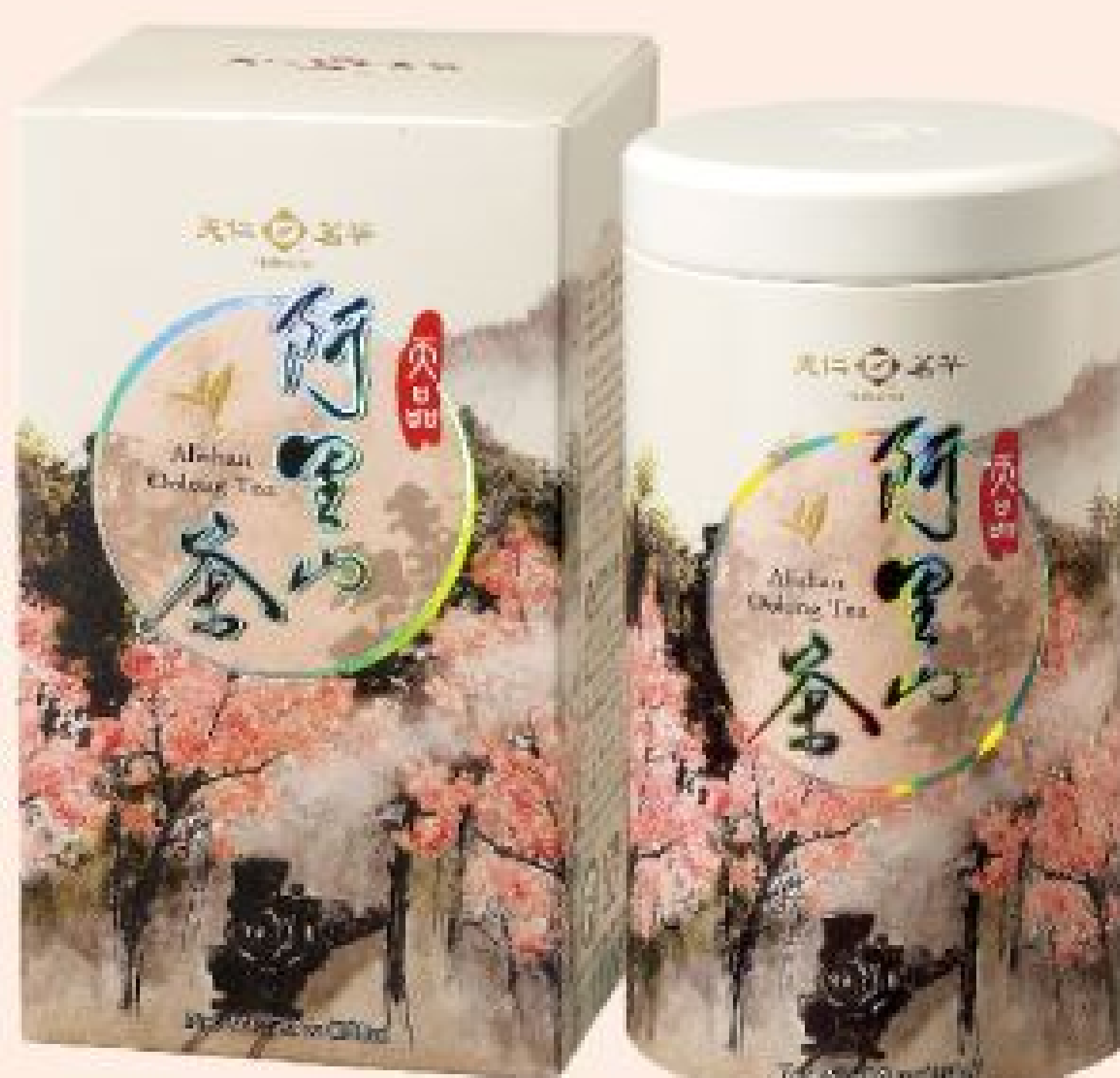
天品阿里山茶 售價：1,500元 (150公克/罐)