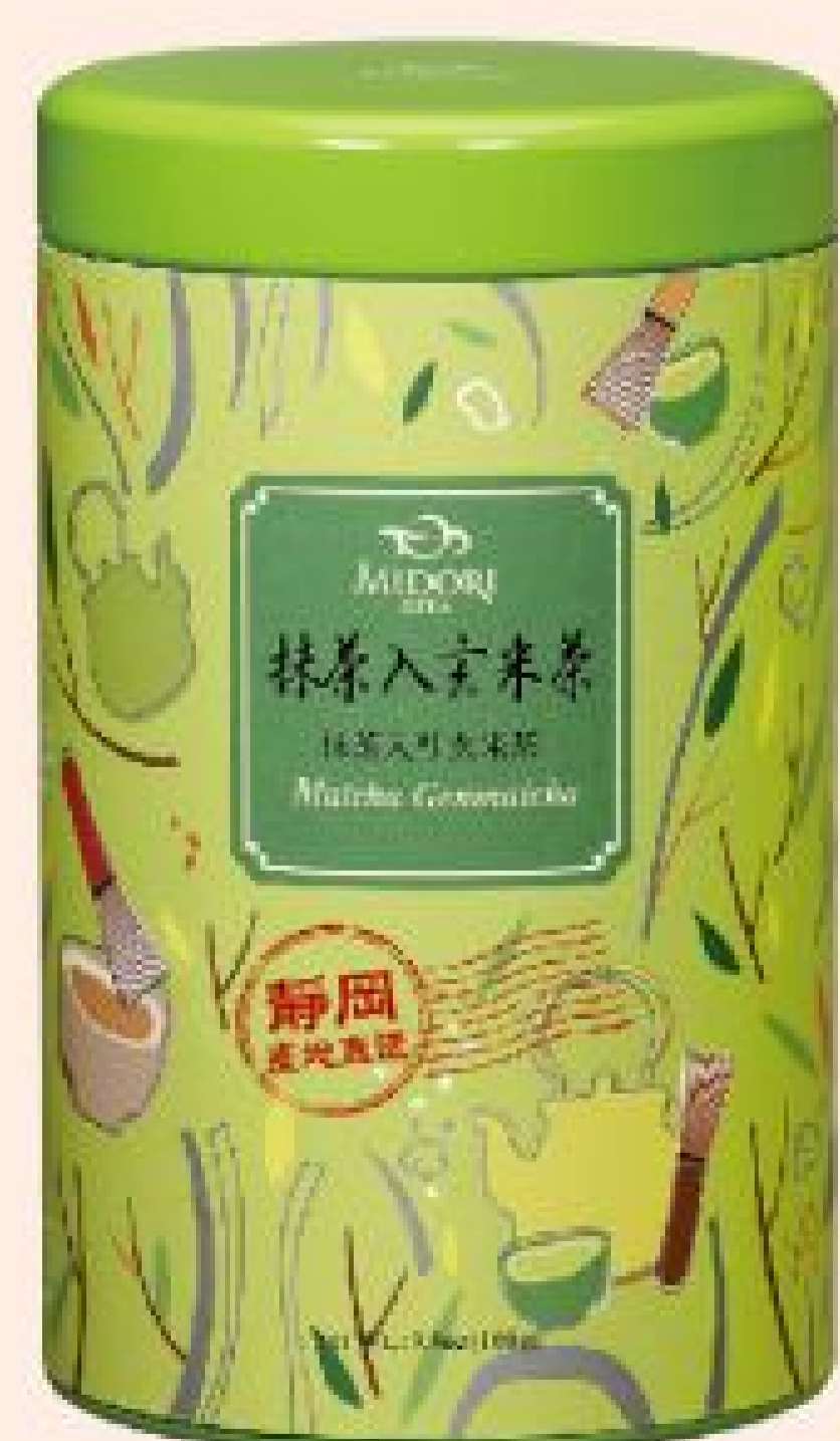
抹茶入玄米茶 2罐特價：750元 2罐原價：900元 (100公克/罐)