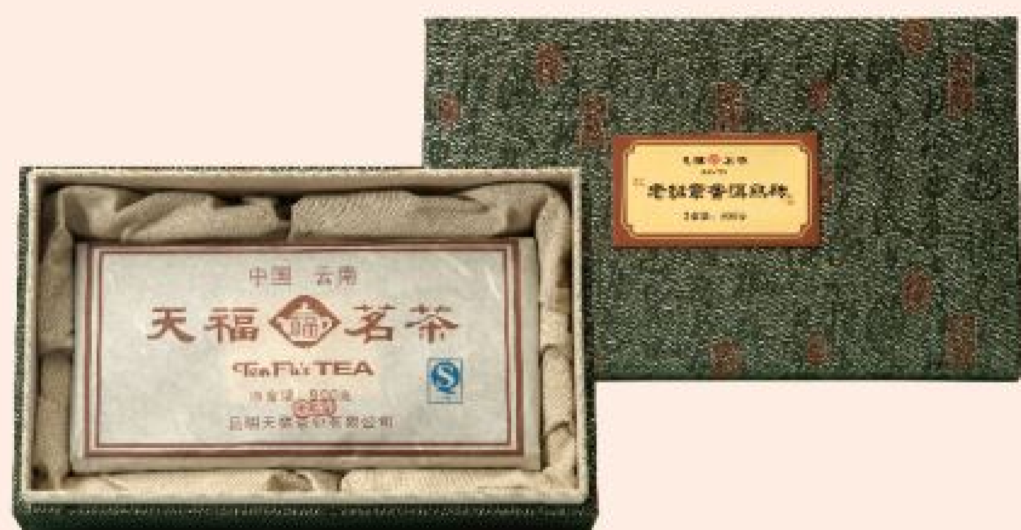
老班章普洱熟磚 售價：22,000元 (900公克/盒)

清朝乾隆年間，普洱府進京上貢，風雨兼程趕往京城，在品茶大賽中皇帝見湯色紅濃明亮，猶如紅寶石，香味醇厚，綿甜爽滑。乾隆大悅道：「此茶何名？」，回之「此茶為雲南普洱府所貢」。故命之普洱茶。