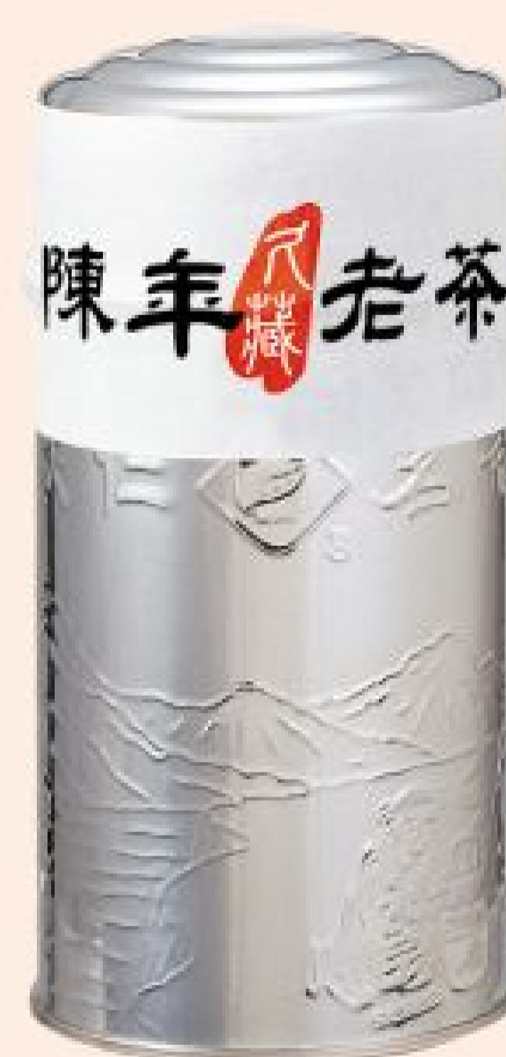
陳年久藏老茶 2罐特價：1,760元 2罐原價：2,000元 (150公克/罐)