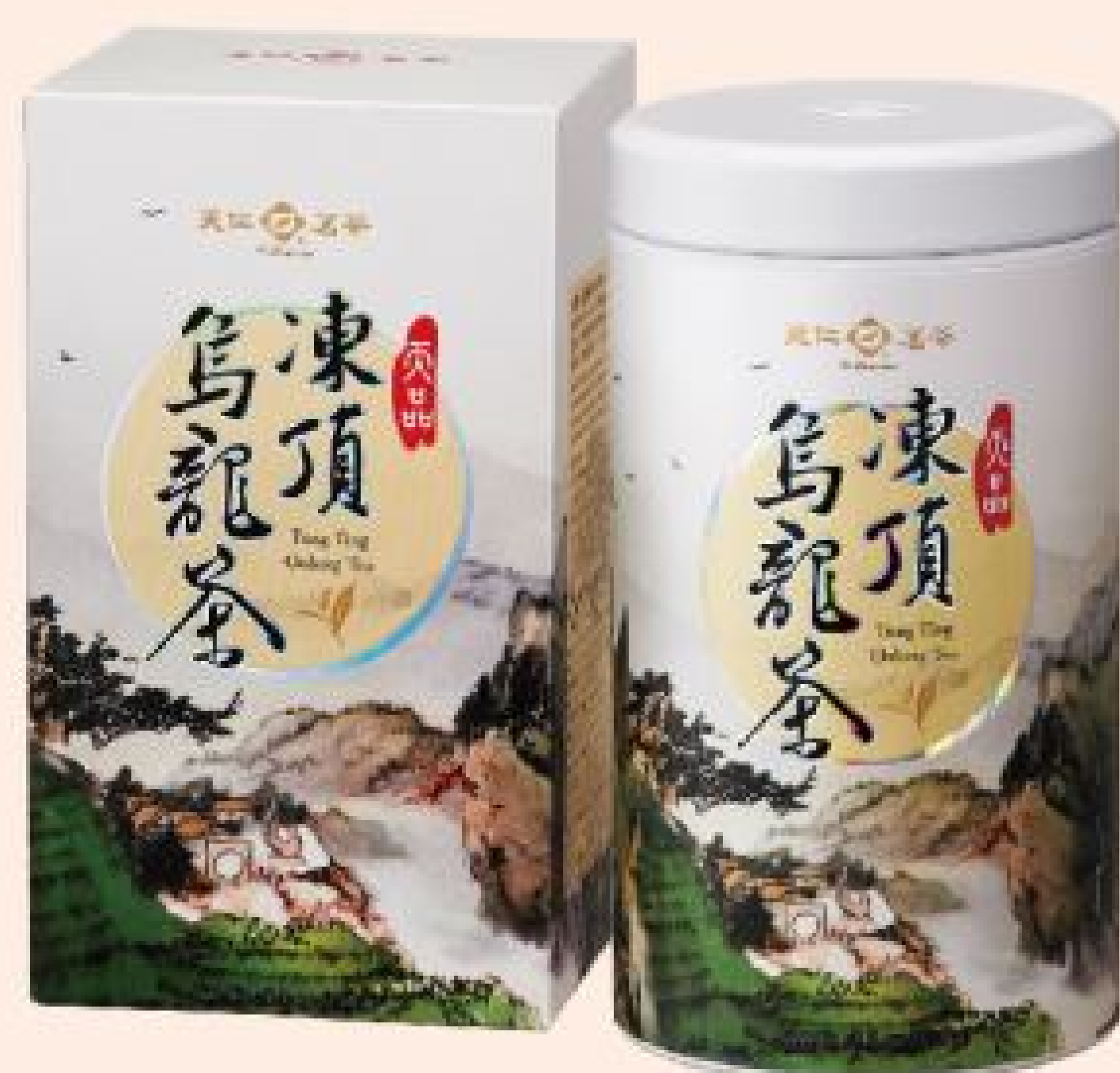
天品凍頂烏龍茶 售價：1,400元 (150公克/罐)