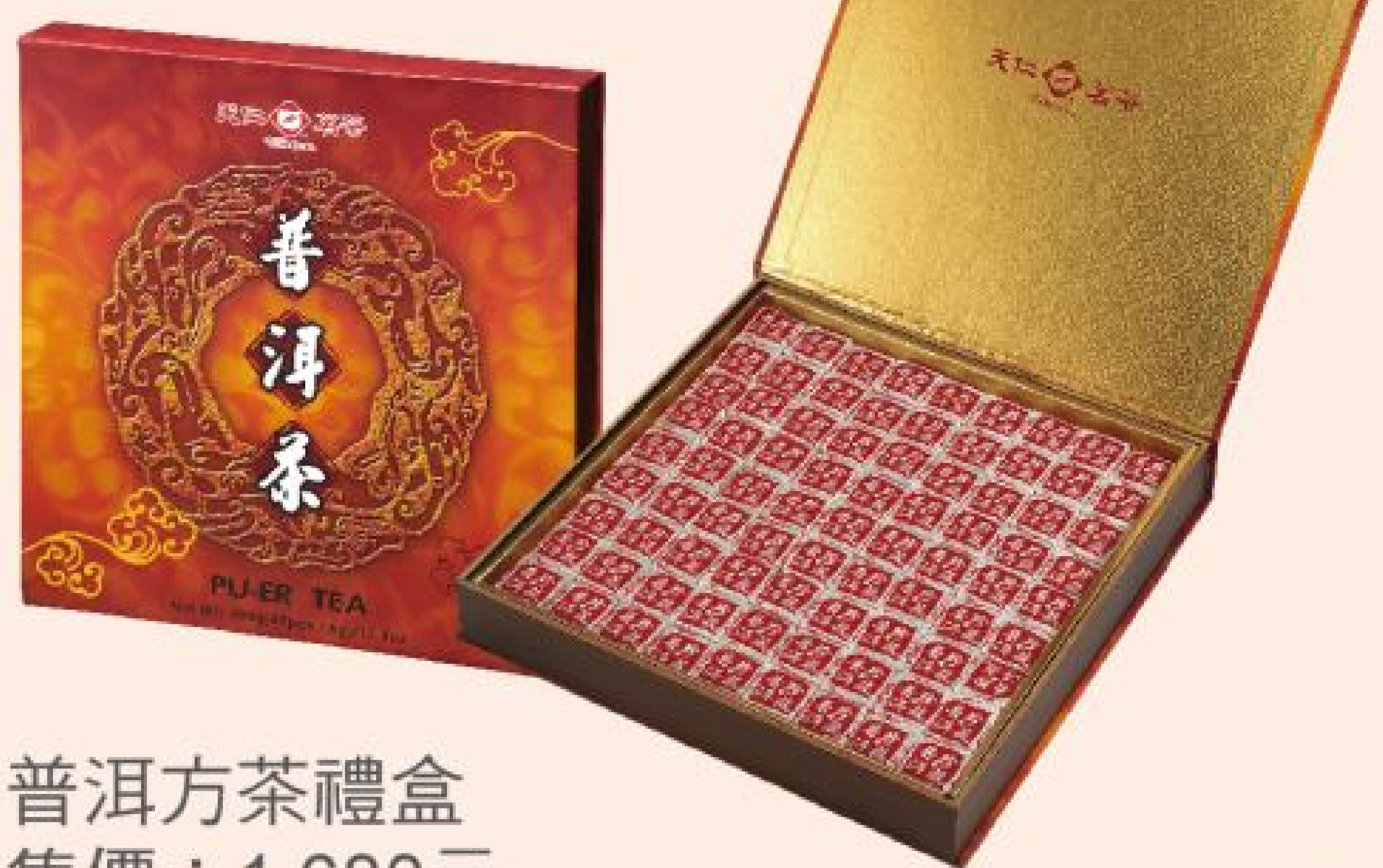
普洱方茶禮盒 售價：1,680元 (486公克，81入/盒)