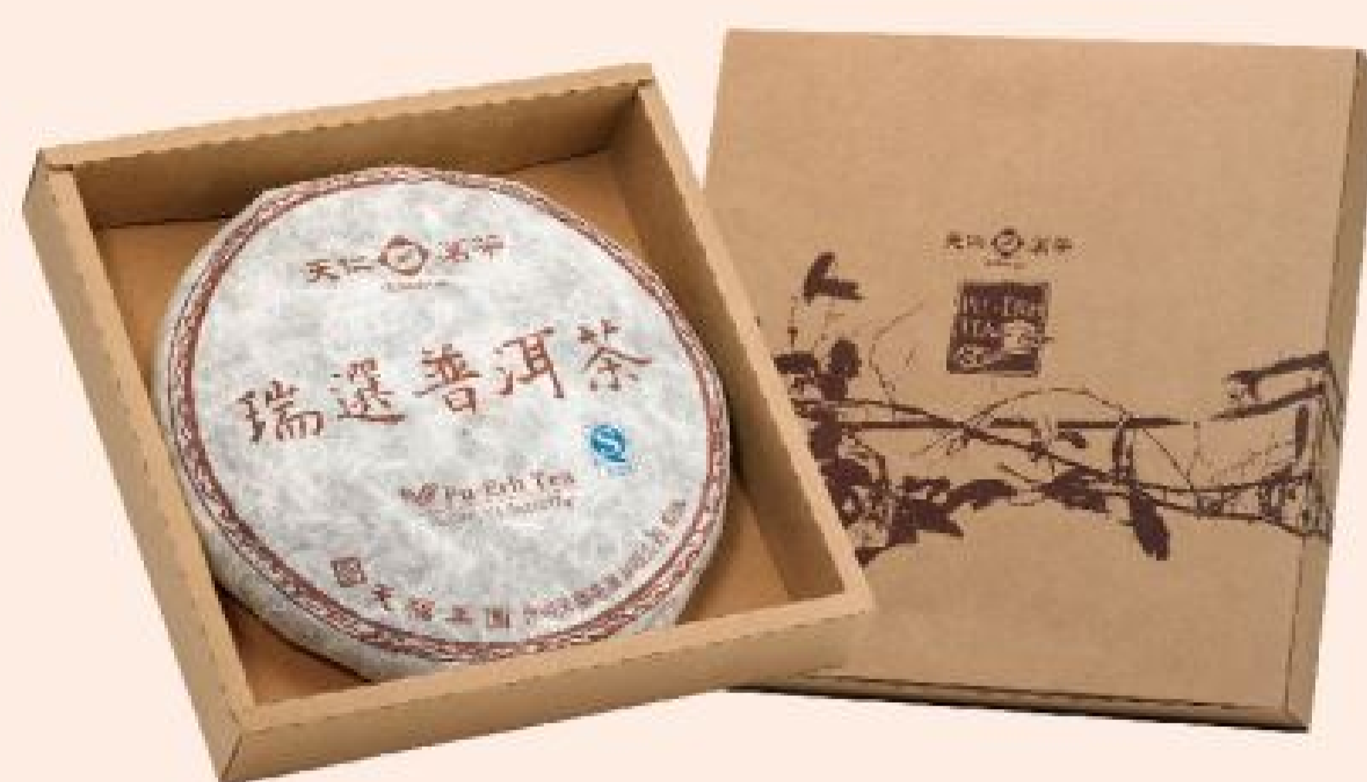
瑞選普洱茶餅 特價：990元 售價：1,200元/片 (327公克/片)