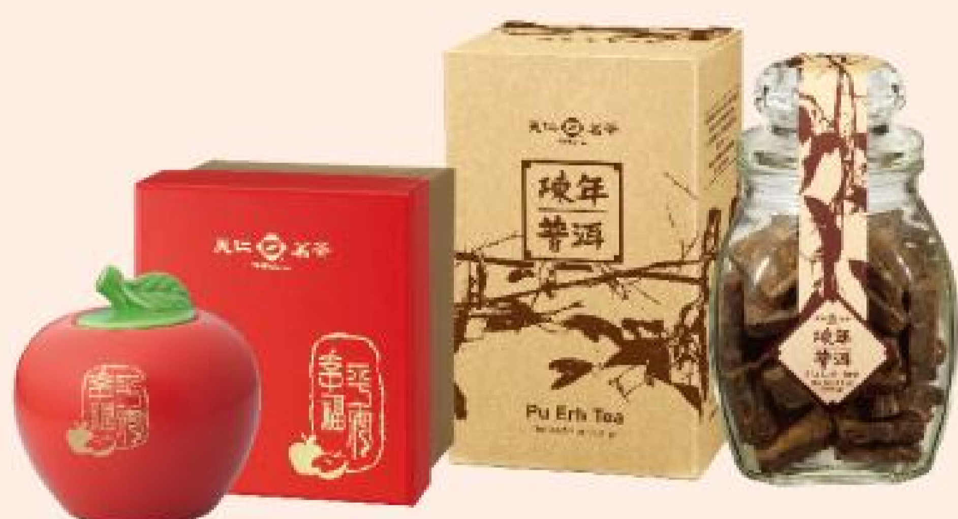
平安幸福 (陳年老茶) (50公克/罐) 陳年普洱 (150公克/罐) 任2罐特價：880元 2罐原價：1,040元