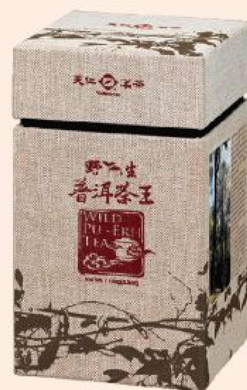
野生普洱茶王 2罐特價：1,760元 2罐原價：2,000元 (150公克/罐)