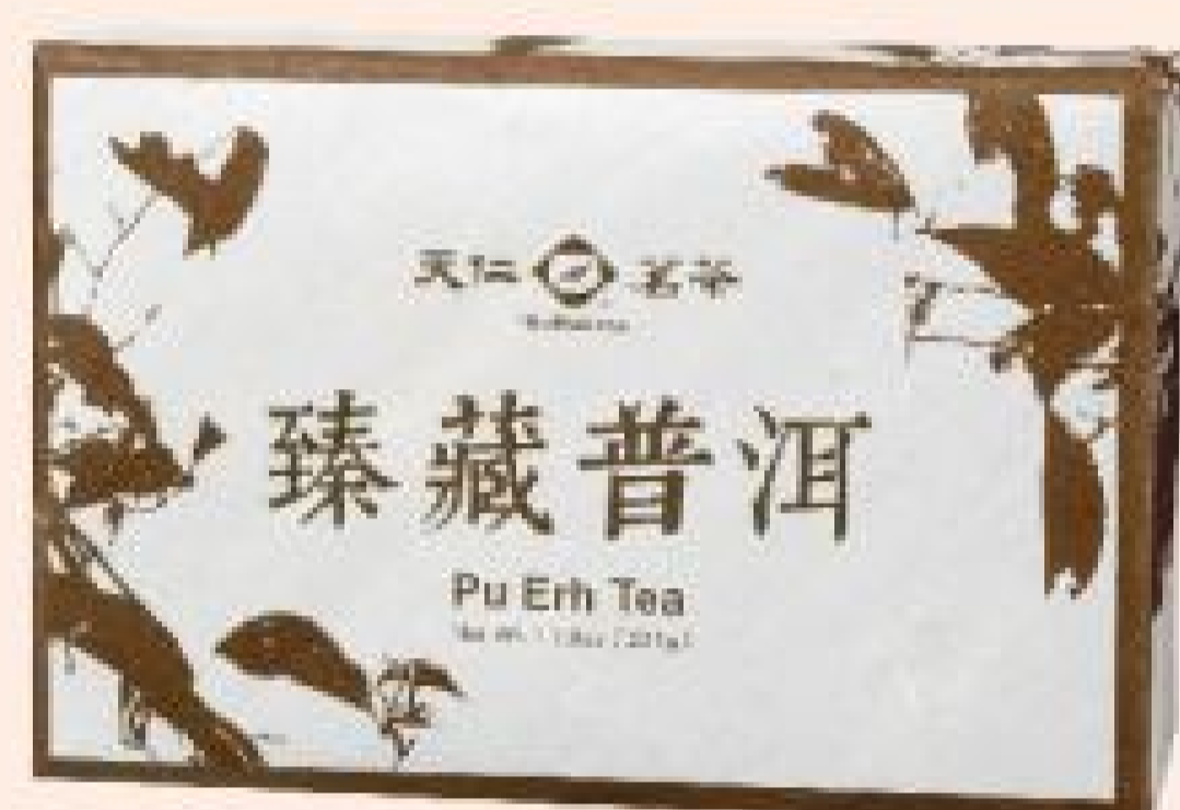
臻藏普洱 售價：500元 (225公克/片)