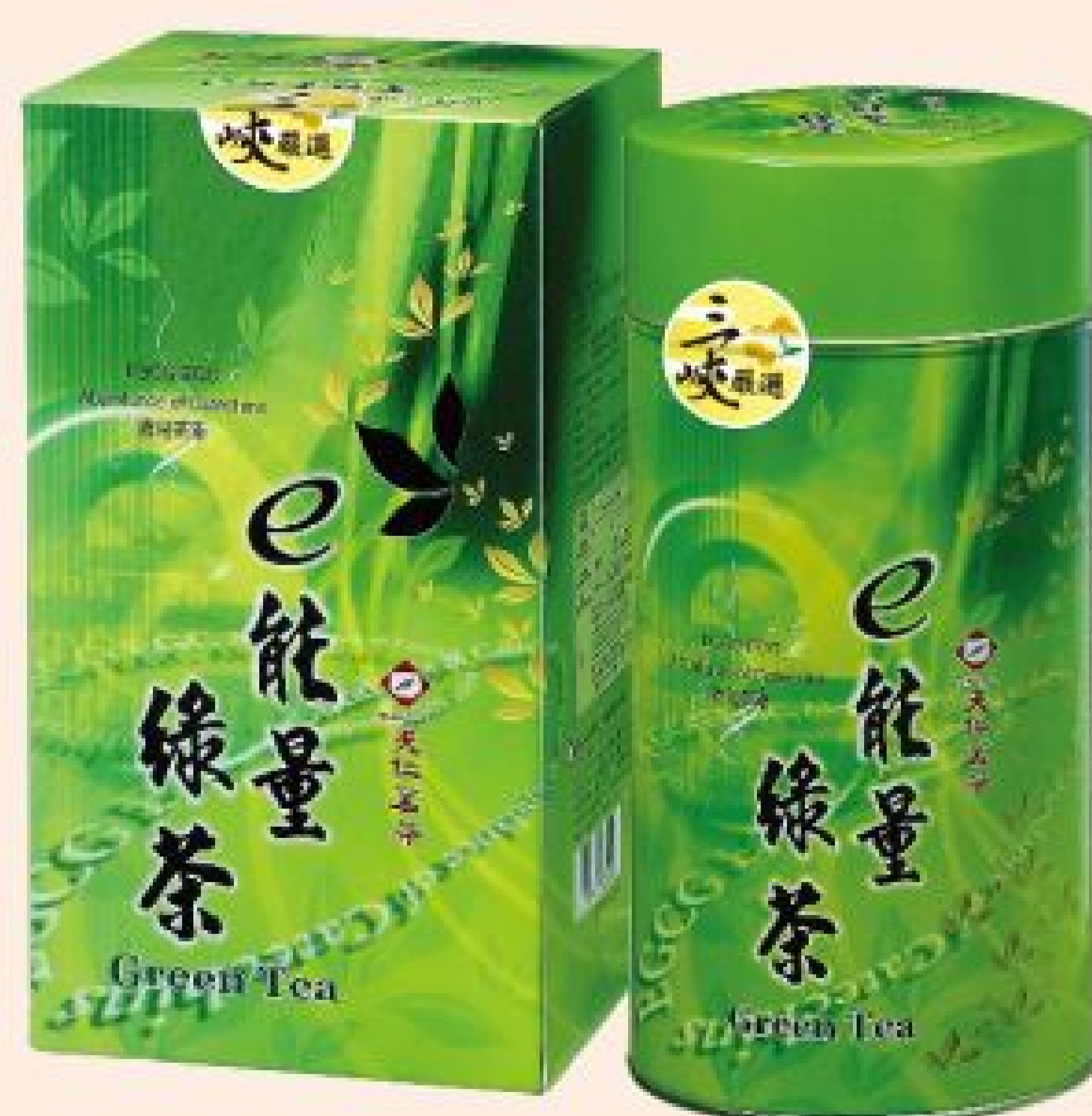
e能量綠茶 (特級碧螺春綠茶) 2罐特價：1,200元 2罐原價：1,440元 (150公克/罐)