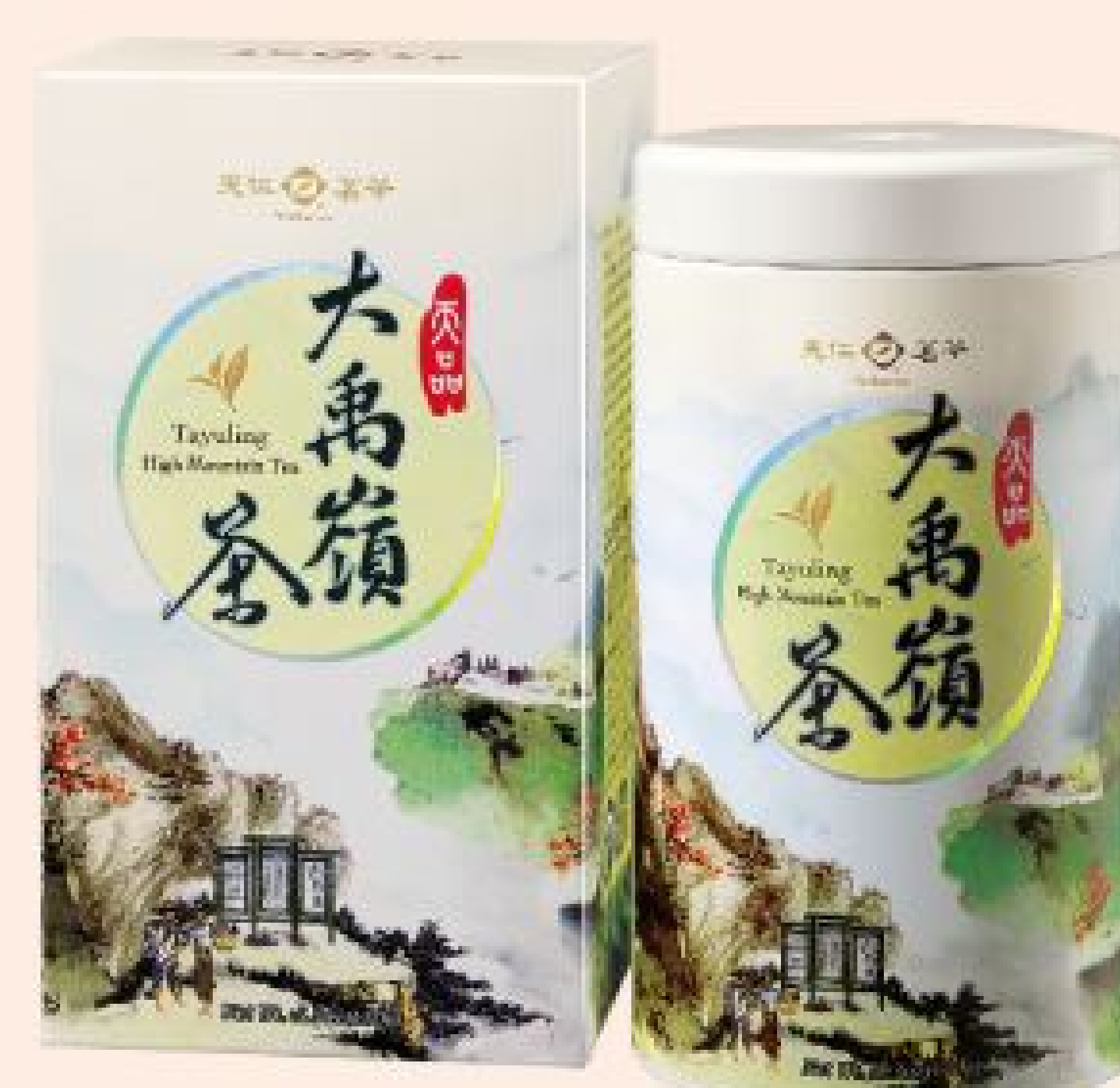
天品大禹嶺茶 售價：1,600元 (150公克/罐)