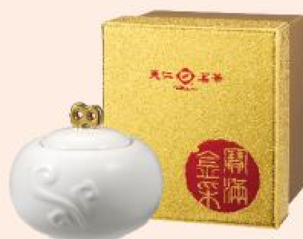
寶滿金采 (宮廷普洱) 2罐特價：980元 2罐原價：1,160元 (40公克/罐)